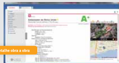
Detalhe obra a obra