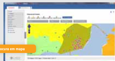
Procura em mapa