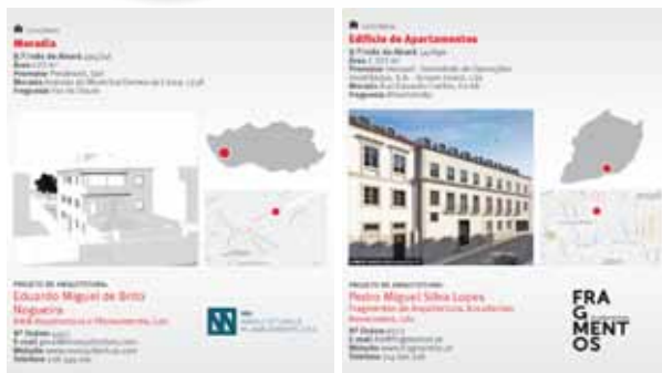
EXEMPLO DE FICHAS DE OBRAS | ANUÁRIO 2015

A edição impressa abrange os mercados de Lisboa e Porto, sendo os demais Municípios apresentados na edição eletrónica.