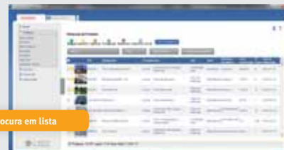
Procura em lista